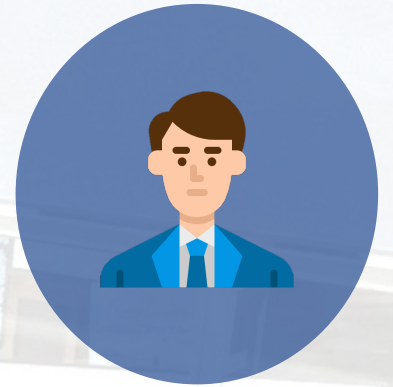
ผู้ประกอบการ