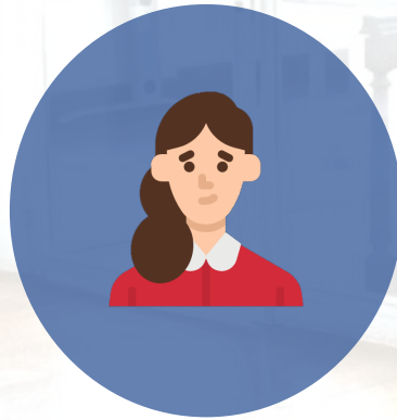
นักศึกษา