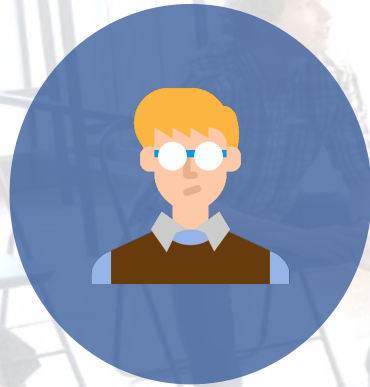
นักวิจัย